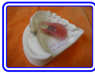
金属部分はレジンで覆われている ため金属による弊害は少ないです