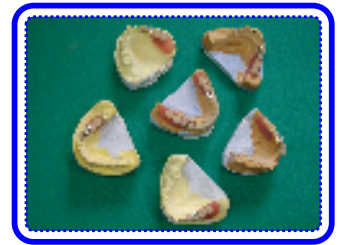
いろんな遊離端義歯に対応 採用されております