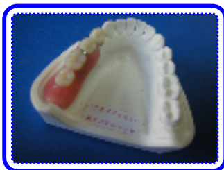
口を開いても義歯を入れて いるとは気づかれませぬ