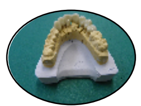
ジルコニアブリッジも可能になりました