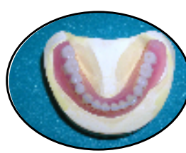
リベース材はムコブレンコンフォートを使用