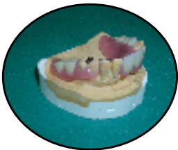
メタルクラスプは全く使用しないので目立たない