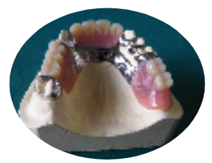
金属床のバージョンUP 唇側にクラスプを無くした スイングウエッジ金属床