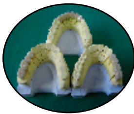
オールセラミック シングルクラウンから インプラント上部構造まで

歯冠修復のメタルレス化として、ジルコニア等色々とオールセラミックがあります。中でもe-maxは、エンプレスIIの後継品。生体親和性はもとより審美性も良好です。一歯欠損のクラウンBRにも対応し他にはラミネートベニア、インレーと、あらゆる製作が可能という事で、症例に幅広く対応できると思います。色、つや等の審美性で言えば数種類あるオールセラミックの中では一番だと思います。・特に前歯～小臼歯にかけてのBr等の症例におすすめてです。実際に、装着された患者さん達の喜ぶ姿も見ることがあり、取り組まれたドクターからも高い評価を頂いています。機会がありましたら、是非ご検討下さい。