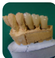
インプラント こんなもの