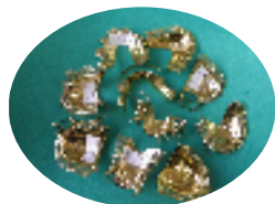
チタンクラウンブリッジと イオンコーティング