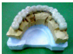
インプラント 臨床